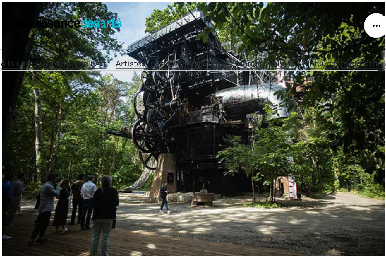
Jean Tinguely, Le Cyclop, 1969-1994 FNAC 95419 Donation Jean Tinguely, Niki de Saint Phalle à l'Etat en 1987 / Centre national des arts plastiques

La restauration du monstre d'acier, de verre et de métal voit aussi fleurir de nombreuses initiatives pédagogiques. Des projets d'éducation artistique et culturelle autour de la restauration du Cyclop et de l'aménagement de ses abords associent de nombreux lycéens et étudiants. Une œuvre participative, en symbiose avec la façon dont elle a été pensée à ses débuts, qui fait du Cyclop un lieu de connexion entre les arts et la nature que l'Association Le Cyclop s'efforce de promouvoir.